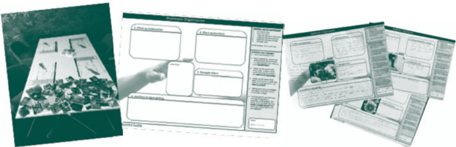
Figuur 2.2: De startsituatie, een leeg invulformat en drie ingevulde formats voor één sleutelmoment